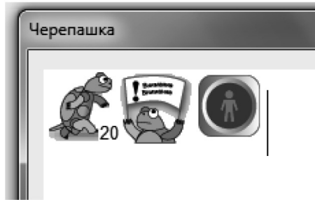
Рис. 1. Внешний вид команд в ПервоЛого

Используя совокупность инструментов ПервоЛого, можно создавать небольшие анимированные рассказы, персонажи в которых перемещаются, общаются друг с другом, реагируют на внешние команды. Действия могут происходить в нарисованном учащимся месте. В этом случае автор сюжета должен воспроизвести достаточное количество деталей сцены, чтобы место событий было узнаваемым. При наличии основных навыков работы в программе (чего можно достичь в первую половину учебного года при частоте занятий не реже 1 часа в неделю) учащийся может создавать полноценные мультфильмы, простейшие игры (в таком случае в сцене должен быть определён основной действующий персонаж, который будет реагировать на команды, поступающие от пользователя, например, при нажатии соответствующих кнопок) и делать анимации практически любой задуманной ситуации. Большим преимуществом программы можно считать возможность записи звуков и голоса. Учащиеся, знакомые с нотной грамотой, могут самостоятельно написать и озвучить музыкальные фрагменты, используя только возможности программы (рис. 2).